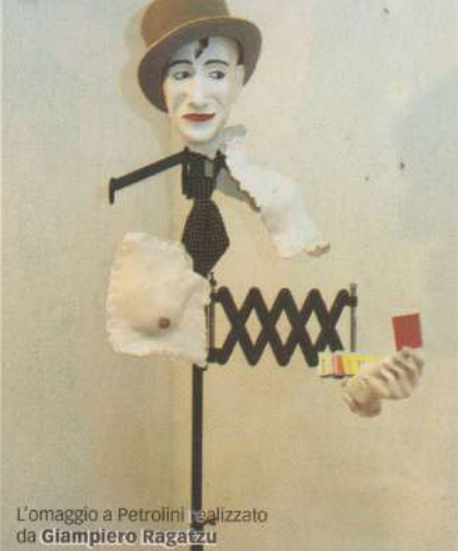
L'omaggio a Petrolini realizzato da Giampiero Ragatzu